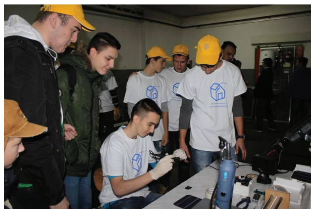
Praktični dio festivala

U prvom dijelu festivala posjetiteljima je održana interesantna video i foto prezentacija o načinima primjene solarne energije nakon čega su posjetili izložbu različitih solarnih sistema za grijanje vode, fotonaponskih sistema za proizvodnju električne energije, solarno vozilo isl. većinom proizvednih u Centru za razvoj i podršku.