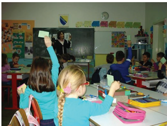
Veseli kreativni i pametni, najmlađi učenici naše škole