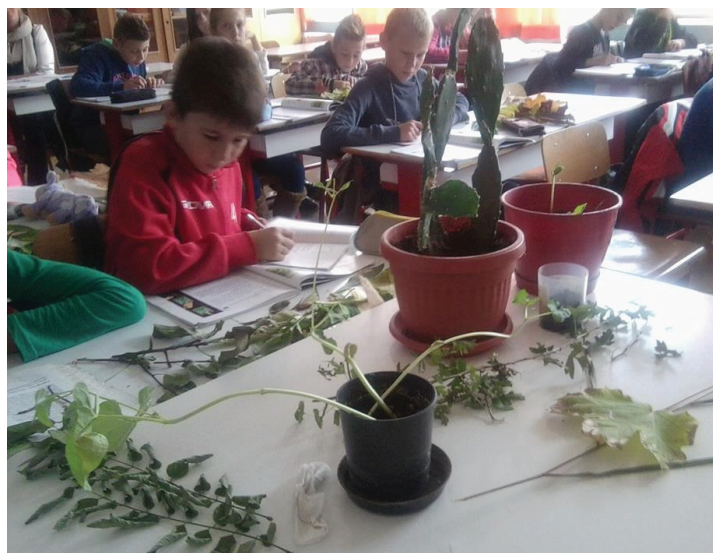
Ogledno-ugledni čas nastavnice Suade