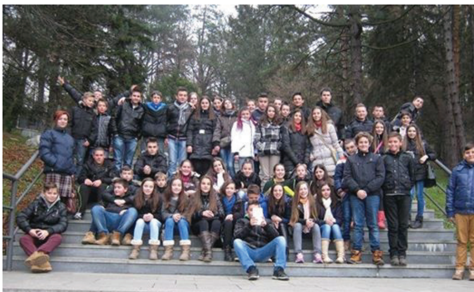
Terenska nastava u okviru časa odjeljene zajednice