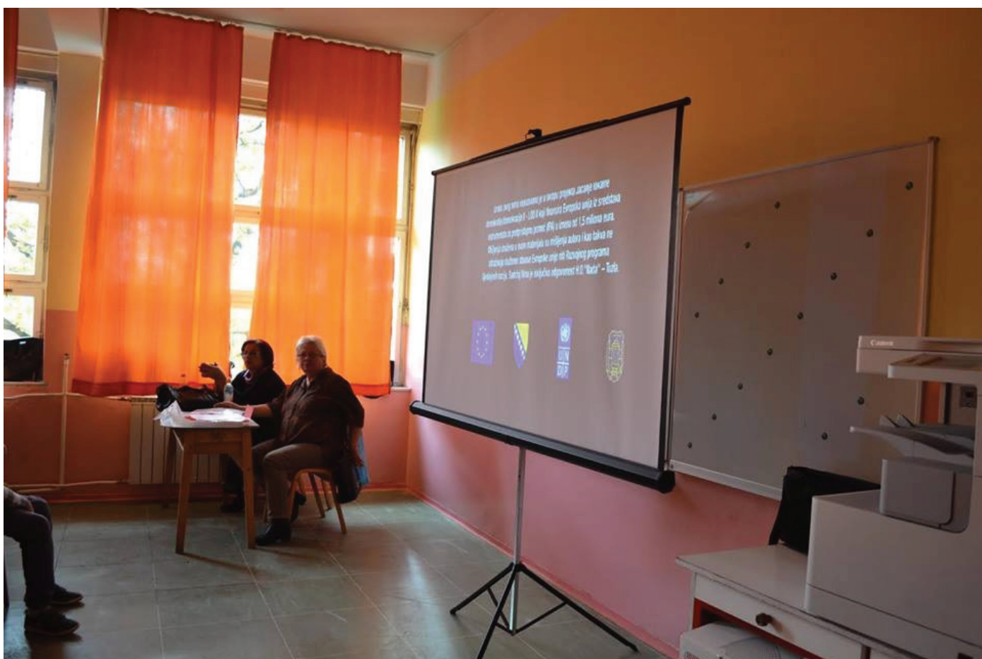
Edukacija o prevenciji korištenja opojnih sredstava

“Da li je neko mogao pretpostaviti, kada ga je pun radosti i strepnje, vodio na prvi čas u školu, u novom odijelu sa novom torbom đaka prvaka, da će jednoga dana to malo biće uredno začesljano majčinim suzama radosnicama, zavezanih kikirika, nekoliko godina kasnije, ležati na podu nekog javnog WC-a krvave ruke iz koje viri špric. Niko to nije pretpostavio, ali se nažalost desilo mnogima.”