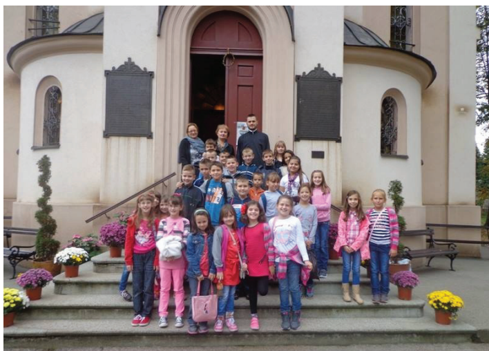
Nezaboravno druženje na terenskoj nastavi