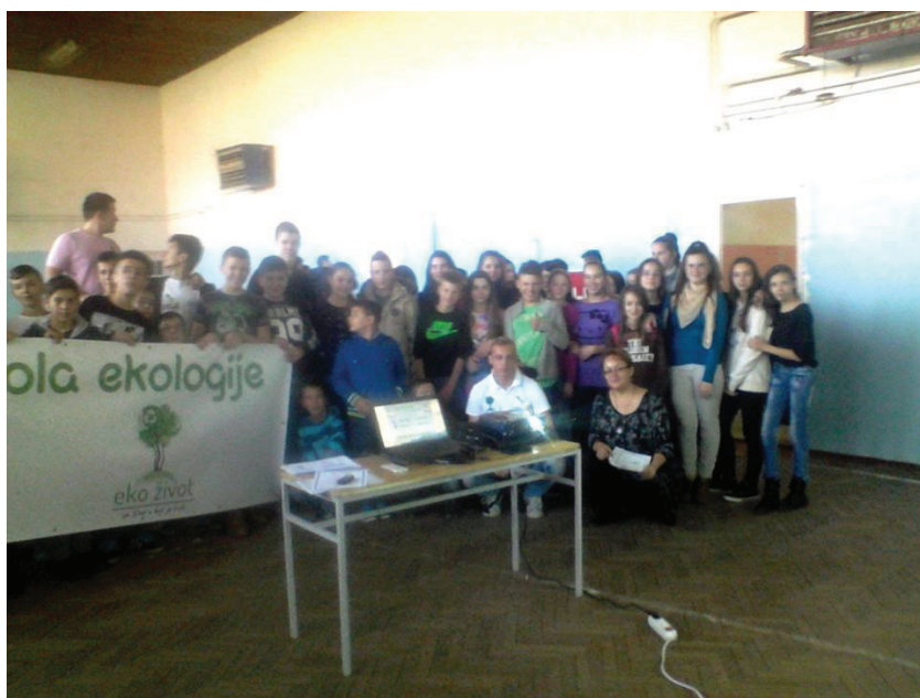
Mala škola ekologije