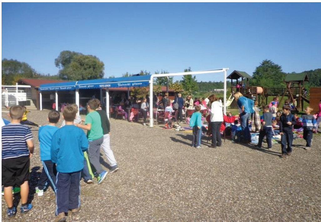
Sportski dan u Ormanici

Nakon današnjeg boravka u prirodi, sutra se ponovo vraćamo uobičajnim školskim aktivnostima.