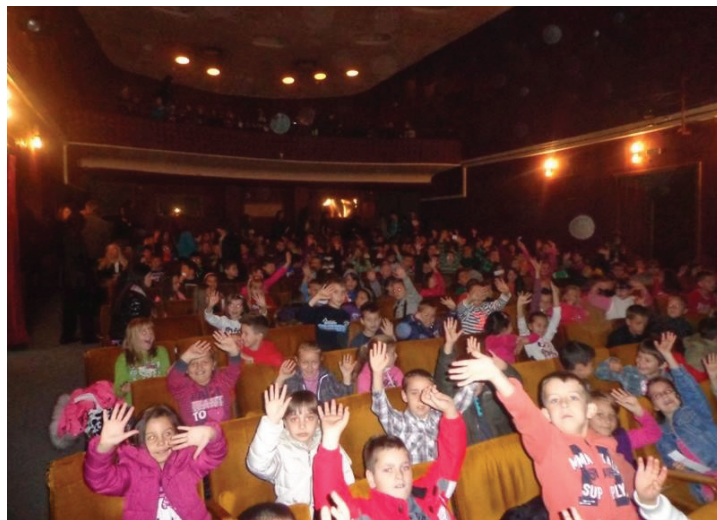
Posjeta Narodnom pozorištu u Tuzli