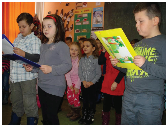
Ponosni na naše najmlađe đake